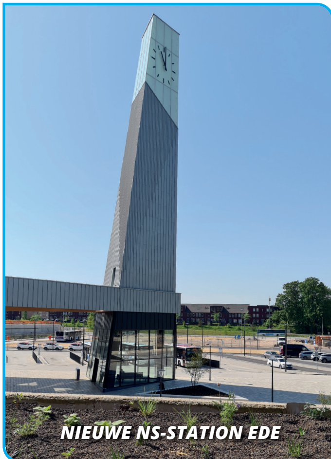
NIEUWE NS-STATION EDE

Maanderweg 70, Ede Tel. 0318 - 62 80 80 www.bolthofvandentop.nl