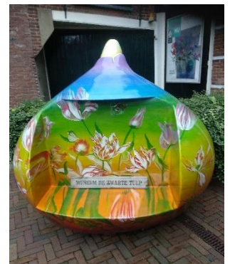
Museum De Zwarte Tulp