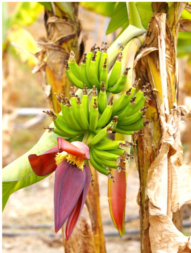
(Bananen in Tertsá, Kreta, 10-05-2024)