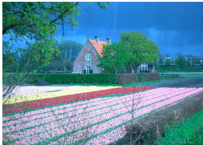
De zon schijnt tussen de buien door op de akkers.

Servetten, mokken, placemats, schilderijtjes, alles voorzien van, hoe kan het ook anders, kleurrijke tulpen. In de filmzaal kijken we hoe de tulpen voor 1950 geteeld en verhandeld werden. We mogen tot slot allemaal een bosje verse tulpen mee naar huis nemen, met bol en al.