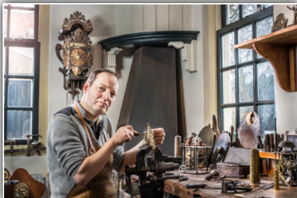
<< Staartklokken Drukkerij >>