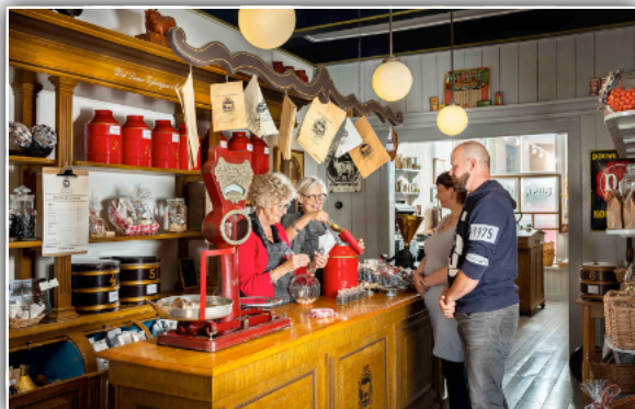
<< Douwe Egberts Kopergieterij >>

Er is van alles over de geschiedenis van Douwe Egberts . U ziet, iconisch voor Joure, Friese (staart)klokken en een industrieel monument, de kopergieterij van Keverling. Ook is er een oude drukkerij met o.a. letterkasten en drukpersen. Misschien hebt u nog tijd om een bezoek te brengen aan de museumwinkel De Witte Os . We sluiten af met een kopje koffie en oranjeboek. En dan is het weer tijd om naar huis te gaan.