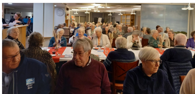
Deze foto is gemaakt tijdens het diner van afgelopen 15 november