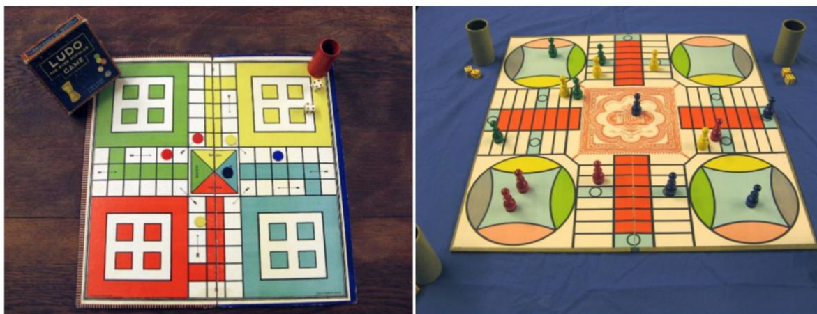
Ludo (l) en Parcheesi (r), twee westerse varianten van het Indiase bordspel Pachisi , waarop ook het latere Mens-erger-je-niet is gebaseerd.

Wanneer Pachisi precies ontstond is niet zeker, maar bronnen suggereren dat het spel al in de oudheid bekend was. In India werd het onder meer aan vorstenhoven gespeeld. Via handelscontacten en Europese aanwezigheid in Azië verspreidden varianten van het spel zich later naar Europa en Amerika . In Groot-Brittannië verscheen in de negentiende eeuw bijvoorbeeld het spel Ludo , terwijl in de Verenigde Staten de variant Parcheesi populair werd.