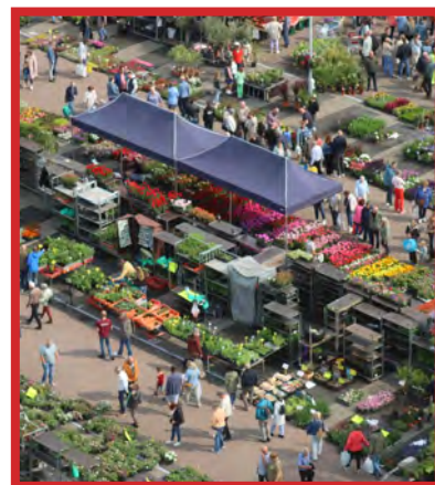
Bloemenmarkt 2e Pinksterdag Krimpen aan den IJssel