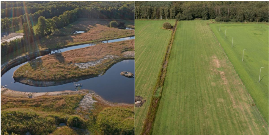
Van schraal weiland naar weelderig natuurgebied

Mijn indruk is dat er soms sprake is van verwaarlozing, maar realiseer mij dat ik dit bekijk met een agrarisch beeld.