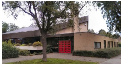
Taborkerk, ons huis

Onze bijeenkomst hier in de Taborkerk voelt als ons thuis.