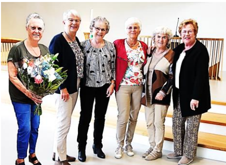
Laatste bestuur Passage

Op woensdag 6 december was een bijeenkomst georganiseerd voor de leden van de bezoekencommissie en de bezorgers van de PCOB-bladen.