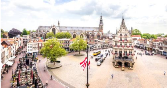
Stadsgezicht Gouda

Iets meer dan 750 jaar geleden kreeg de kleine Nederlandse stad Gouda stadsrechten van graaf Floris V en dat betekende veel voor de stad. Gouda ging stadsmuren bouwen, er kwam een stadsbestuur dat belastingen mocht heffen en er