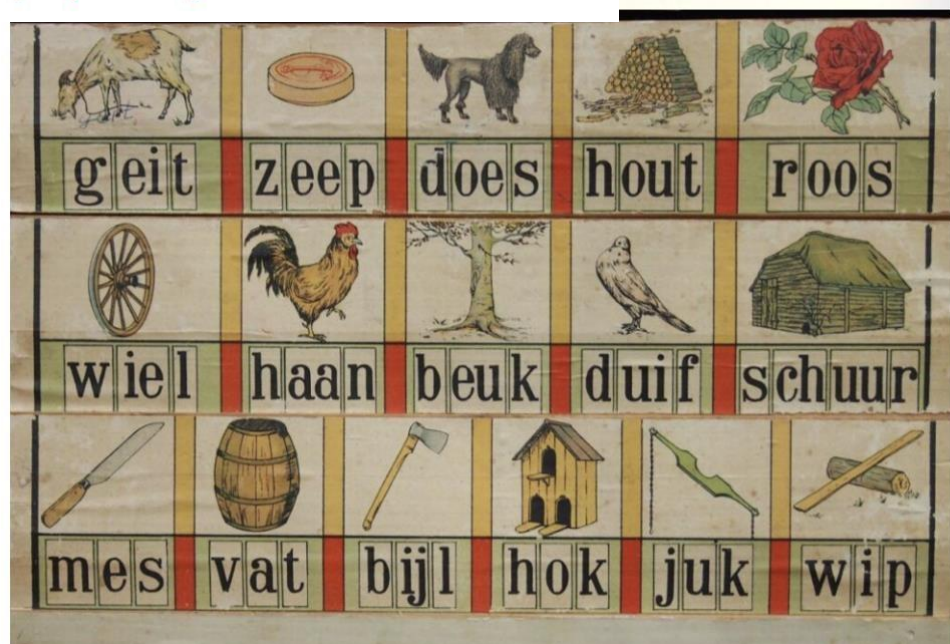
Leesplankje van Colenbrander