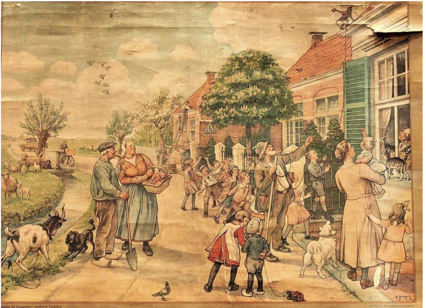
Schoolplaat van Cornelis Jetses met alle figuren van het leesplankje van Hoogeveen.

In de jaren hierna vervaardigde Hoogeveen nog verschillende varianten van het leesplankje. In de eerste klas leerden scholieren met behulp van de plankjes dat woorden ontleed kunnen worden in klanken en dat nieuwe woorden gevormd kunnen worden als verschillende onderdelen samengevoegd worden. En al spelende komen er nieuwe letters bij. Aanvankelijk was lang niet iedereen positief over het leesplankje van Hoogeveen. Het succes kwam pas vanaf 1910, toen de leesmethode overgenomen werd door uitgeverij Wolters.