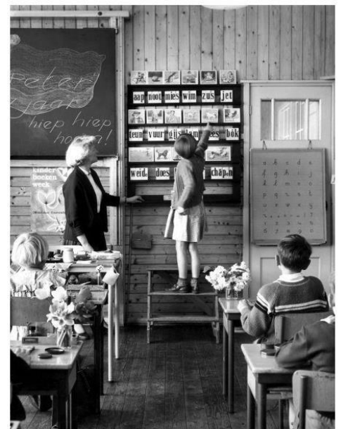
Aap Noot Mies in de klas, 1968

In de afgelopen decennia verschenen er nog allerlei varianten op de leesplankjes. Zo leerden veel Nederlanders bijvoorbeeld ook lezen met de woordjes Boom Roos Vis Vuur , uit de lesmethode 'Veilig leren lezen' van Uitgeverij Zwijsen, die in de jaren zestig werd ontwikkeld. Deze werd later vervangen door een woordreeks die begon met Ik Kim Sim .