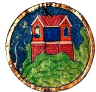
Middeleeuwse voorstelling van Noach met een duif

Mozes verbleef veertig dagen op de Sinaïberg en kreeg toen pas de Tien Geboden. Elia zwierf veertig dagen in diezelfde omgeving en ontmoet dan God. Bij Jezus komen deze verhalen samen als hij zelf ook veertig dagen zich terugtrekt in een woestijn. Daar worstelt hij enorm met zijn roeping, maar uiteindelijk staat hem alles helder voor de geest en begint hij zijn publieke optreden.