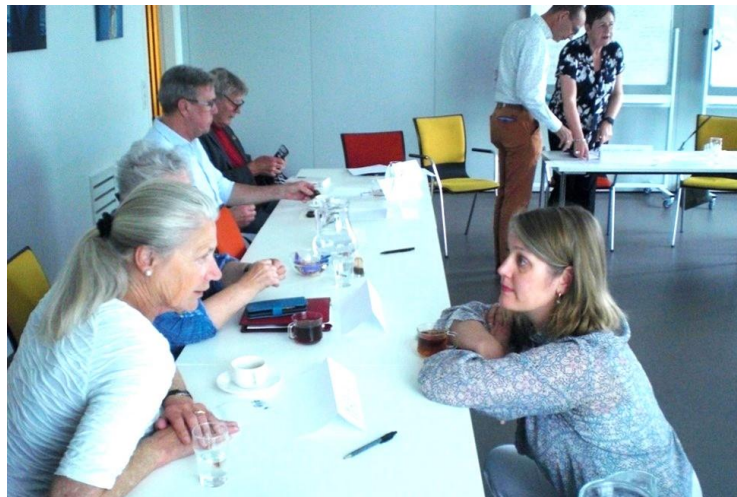
Tijdens de pauze werden de eerste ideeën tot samenwerking al gedeeld.

Het resultaat van de vraag “waarom deze bijeenkomst” heeft in grote mate aan de wens van de initiatiefnemers voldaan, maar zij zien wel kansen voor een vervolgbijeenkomst met een bredere invulling van mogelijke samenwerking