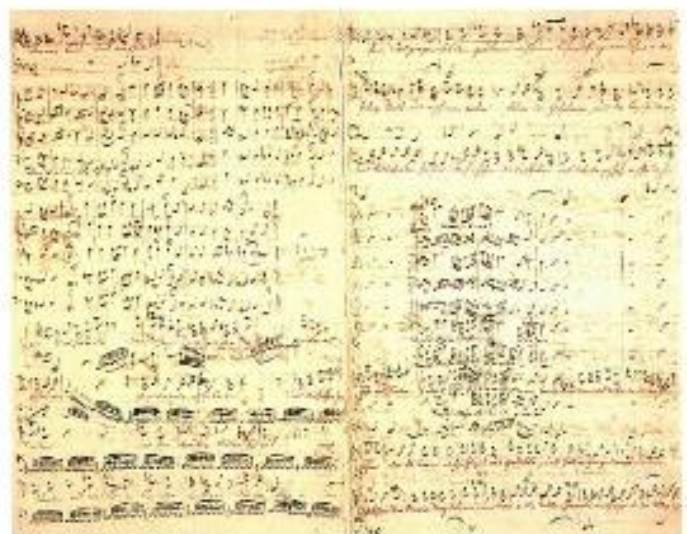
Matthäus-Passion van Bach, 1743–46

Voor zover bekend voerde Bach het stuk zelf vier keer op: in 1727, 1729, 1736 en in 1740. Na zijn dood in 1750 raakte de compositie, net als zijn