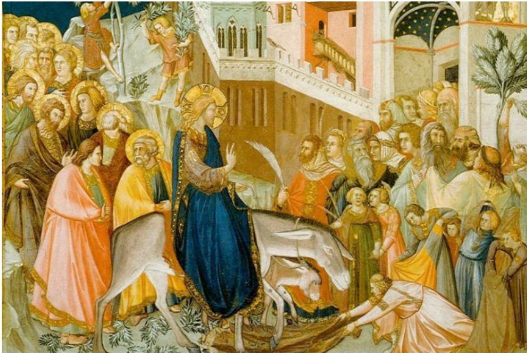
Palmpasen / Palmzondag - De intocht van Jezus in Jeruzalem

De zondag voor Pasen (de laatste zondag van de vastenperiode) staat bekend als Palmzondag, ook wel Palmpasen of Passiezondag. Het is de eerste dag van de zogeheten Goede Week, waarin het lijden, sterven en de verrijzen van Jezus Christus worden herdacht.