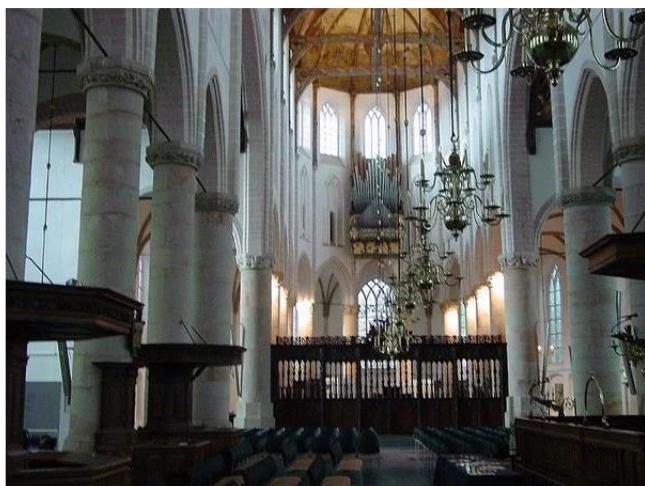
Grote of St. Vituskerk in Naarden

Op 8 april 1899 voerde dirigent Willem Mengelberg de Matthäus-Passion voor het eerst met het Concertgebouworkest uit. Deze ingekorte versie werd opgevoerd door een groot orkest en een koor van 450 personen. De opvoering wordt wel gezien als hét begin van de Matthäus-traditie zoals die vandaag de dag in Nederland bestaat. Geïnspireerd door de opvoering van Mengelberg werd het stuk hierna namelijk op steeds meer plaatsen opgevoerd.