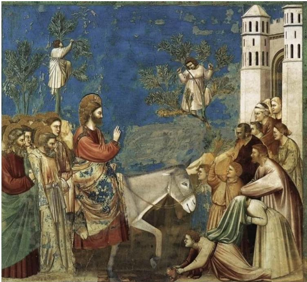
Jezus komt Jeruzalem binnen (Publiek Domein – wiki)