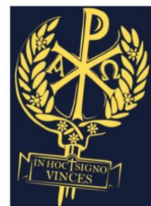
In hoc signo vinces (XP-teken).

Het Tolerantie-edict markeert een cruciaal moment in de wereldgeschiedenis: feitelijk gingen staat en kerk op dat moment een verbond aan. De Rooms-Katholieke Kerk begon zichzelf vanaf deze gebeurtenis ook steeds meer te zien als de geestelijke opvolger van het staatkundige Romeinse Rijk, dat daarna in verval zou raken