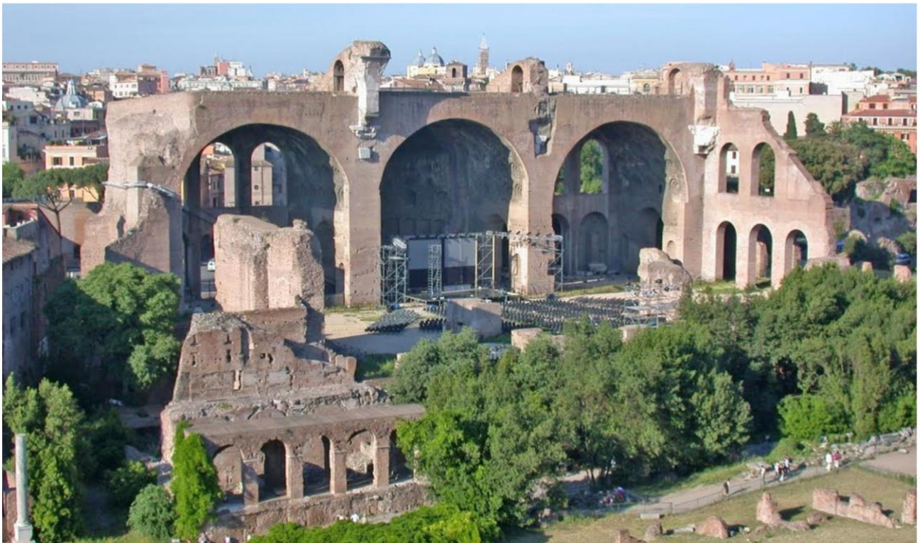
Basilica van Maxentius.

Constantijn had meerdere zonen en ook twee dochters bij twee vrouwen. Hij liet zich om machtspolitieke redenen van zijn eerste vrouw Minervina scheiden, terwijl hij in 326 zijn tweede vrouw Fausta – die hij in 307 had getrouwd om een bondgenootschap met haar vader Maximianus te sluiten – en zijn zoon Crispus, uit Constantijns eerste huwelijk doodde. De motieven achter dit gezinsdrama zijn niet duidelijk, omdat de bronnen elkaar tegenspreken. Een van de bronnen noemt als mogelijk motief seksuele gemeenschap tussen Crispus en Fausta. Hoe het ook zij, duidelijk moge zijn dat Constantijn korte metten maakte met familieleden die hem niet bevielen. Datzelfde gold voor onderdanen die zich in juridische zin niet schikten naar de wet. Om een voorbeeld te noemen: slavinnen of chaperons (deze begeleidden andere mensen tijdens sociale gelegenheden) die niet goed opletten op hun vrouwelijke compagnon en niet voorkwamen dat ze door een man verleid werd, kregen gesmolten lood in de keel gegoten.