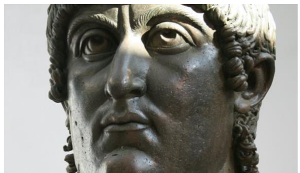
Contemporain bronzes hoofd van Constantijn (4e eeuw, Musei Capitolini)

De erfenis van de Romeinse keizer Constantijn de Grote (ca.280-337) is enorm. Hij stond het christendom toe in het Romeinse Rijk en werd zelf, hij bekeerde zich op zijn sterfbed, de eerste christelijke keizer. Constantijn bepaalde dat de zondag de rustdag zou worden. Ook verplaatste hij de Romeinse hoofdstad naar Byzantium, de stad die hij omdoopte tot Constantinopel (het huidige Istanbul) en gaf hij opdracht tot de bouw van monumentale kerken als de St. Pieterbasiliek in Rome en de Heilige Grafkerk in Jeruzalem.