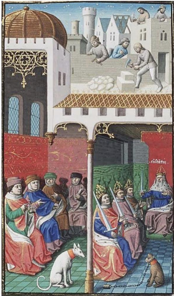
Constantijn en zijn drie zonen.

Gedurende zijn regeerperiode gaf Constantijn niet alleen de bisschoppen meer formele macht, ook gaf hij opdracht tot de bouw van talrijke basilieken en kerken. De beroemdste waren de Sint-Pietersbasiliek in Rome, de Heilige Grafkerk in Jeruzalem en de Basilica van Maxentius aan het Forum Romanum in Rome.