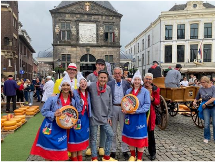
Op de achtergrond de Waag

Op verschillende kraampjes rondom lagen allemaal kleine pondkaasjes, die flink verkocht werden. Ook rook het er naar verse stroopwafels, die afgebakken werden waar je bij stond.