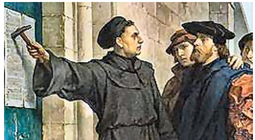
Maarten Luther spijkt de 95 stellingen op de deur van de slotkerk in Wittenberg

En dan willen wij als organisatie al die stromingen verbinden. Inderdaad. En gelukkig gaat dat meestal gewoon goed. Met 'protestant' maken we duidelijk hoe wij ons, in grote lijnen,