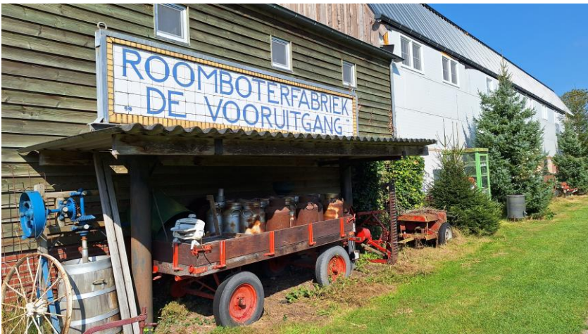
Langs het Melisse pad,(klompenpad) naar de Glind. (eigen foto redactie 15 sept 2024).